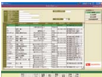
ステックスメニュー